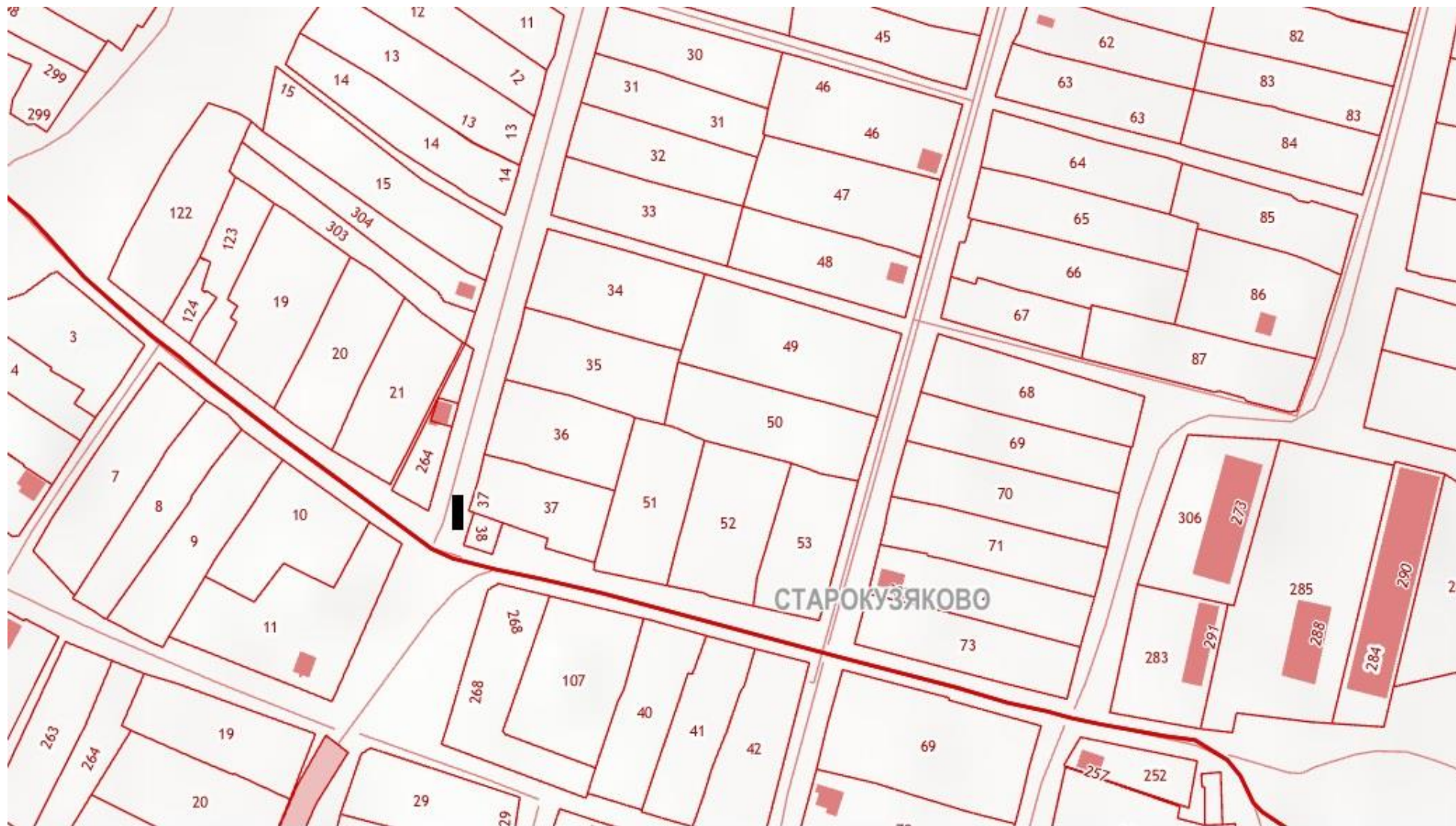
■ Место для размещения нестационарного торгового объекта